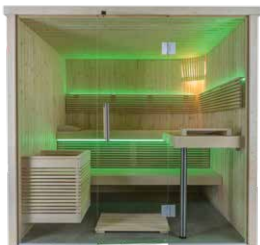
Modelo PANORAMA L Medidas 2,139x2,152x2,01 m