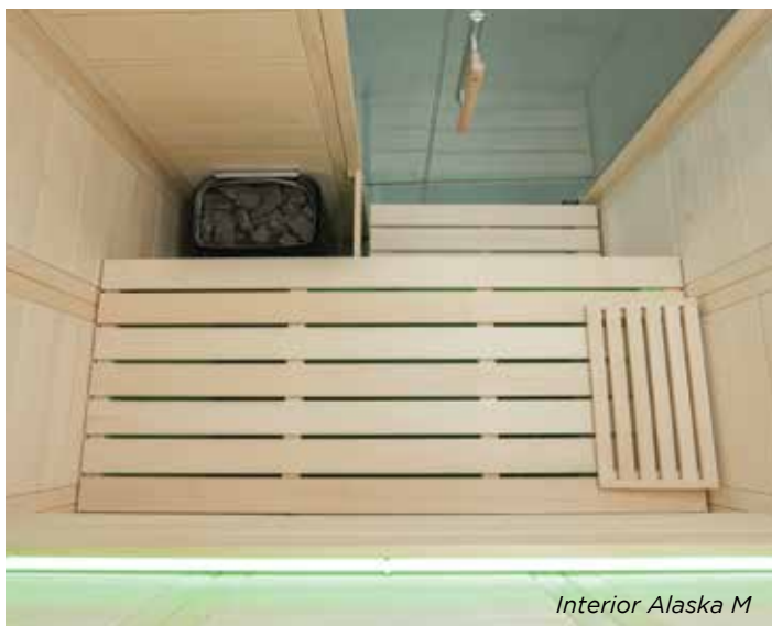
Interior Alaska M